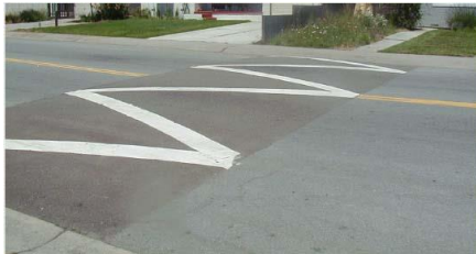
図1. 自動車速度抑制ハンプ

本研究では、従来の固定式(図2の円弧ハンプ・台形ハンプ)と違って、ハンプの高さを制御することにより、車種や速度による速度抑制効果のばらつきや緊急車両への対応を解決することが可能であると考え、“可動式ハンプ”のシステムの提案と研究および試作と実験を行う。可動式ハンプとは、ハンプ手前で車種や速度を認識してハンプの高さを制御するシステムであり、実用化の可能なシステムを構築する(図3)。