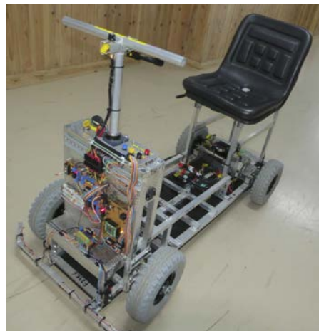
<リアルなリアルタイム OS 実験装置>