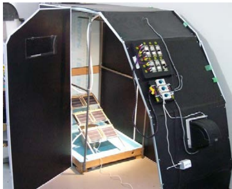
<実環境に対応した太陽電池実験装置>

視線追尾装置を応用して、人間が無意識に思う嗜好の抽出実験も行っている。これは、ユーザーの嗜好に応じて、商品などを素早く提案できるシステム開発を目指す取り組みである。