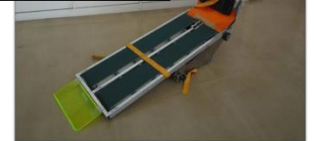
図 2 開発した担架システムの外観

サイズ[mm]: (L×W×H) 1600×550×1000 重量[kg]: 27 (電源込) 電源: Li-ion14.8[V]×2