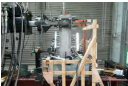
正負交番載荷実験（載荷設備は神戸大学所有）

本研究では、適用事例の少ない PCaPC の下部構造を対象として、柱供試体の縮小供試体による実験で PCaPC 柱の耐震性能および損傷について研究を行った。ここでは一体打ち構造と同等の性能とすることを旨とするのではなく、地震力を受けた際の挙動、損傷の制御に注目し、PCaPC 構造特有の性状を把握することに主眼を置き、下部にフーチングを有する PC 柱供試体を製作し、正負交番載荷を行った。柱は一体打ちのもの、基部にプレキャスト施工を模した接合部を設けた柱を製作し、さらに接合部位置での軸方向鉄筋の本数、連続性、PC 鋼材の配置、導入緊張力などをパラメータとして複数条件で製作した。これらの一体打ちおよび接合部のある PC 柱供試体に水平載荷を行い、構造条件によるエネルギー吸収や残留変位等の耐震性能の違い、接合部を有することによる損傷範囲の違いを比較した。また、損傷の観測においては供試体表面をデジタルカメラで撮影して画像解析によってひずみ分布を捉える非接触ひずみ計測の技術を採用し、目視で確認できないひずみの集中やひび割れの発生をコンター図で示すことができた。