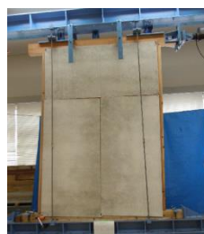
耐力壁の面内せん断試験