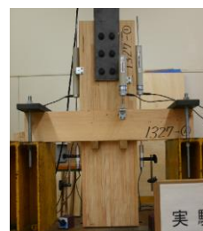
接合部の引張実験