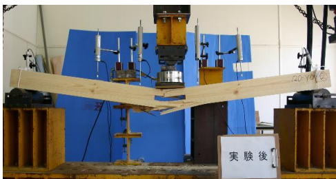
断面欠損を有する柱の曲げ実験

本実験室には木質構造の標準的な構造実験を実施できる試験機や計測機器が整えられている。また多くの構造実験を実施した実績より、実験方法や計測方法などのノウハウを十分に持ち合わせている。木質構造に関する耐震・耐風設計法やそれに関連する構造実験の実施は対応可能である。