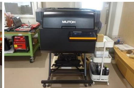
UVプリンター(創造工房)