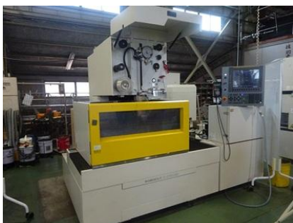
ワイヤ放電加工機