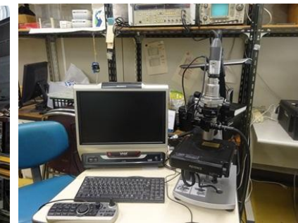
デジタルマイクロスコープ