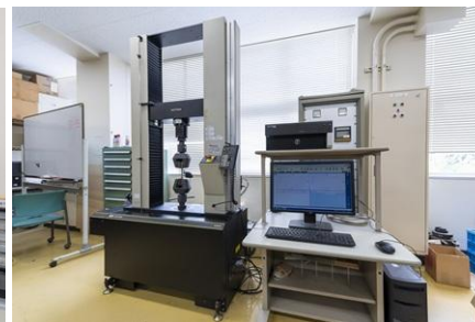
材料試験機（精密万能試験機）