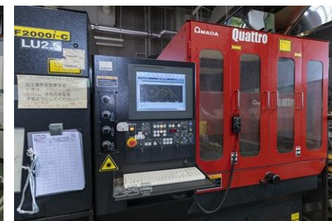
レーザー加工機(実習工場)