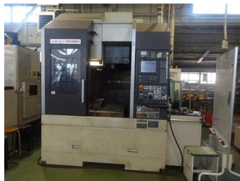
立形マシニングセンター