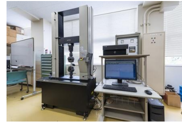
材料試験機（精密万能試験機）