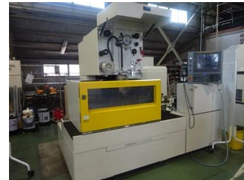
ワイヤ放電加工機