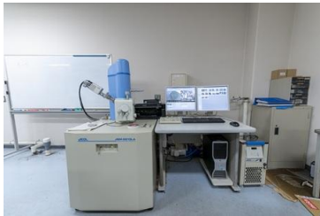
分析走査電子顕微鏡