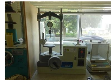
電動式一軸圧縮試験機