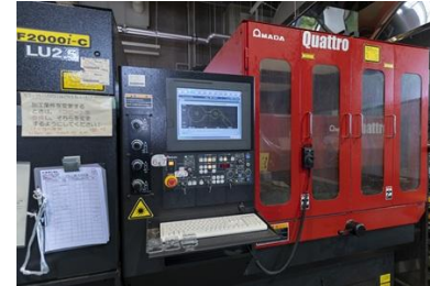
レーザー加工機(実習工場)