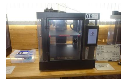
3Dプリンター(創造工房)