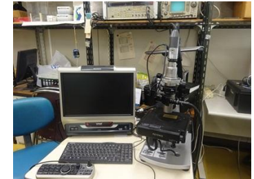
デジタルマイクロスコープ