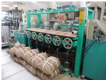
単位断面負荷方式圧密試験機