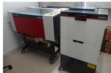
レーザー加工機(創造工房)