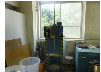
土の自動突き固め装置