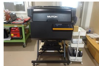
UVプリンター(創造工房)