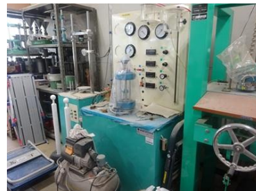
標準三軸圧縮試験機