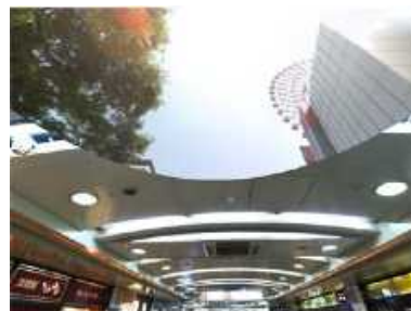
写真3 Wormhole View