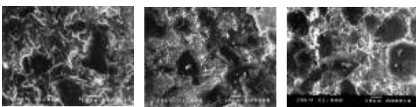
(a) C/MoS 2 膜 (Ar雰囲気中) (b) C/MoS 2 膜 (空気雰囲気中) (c) C/BN膜 (空気雰囲気中)