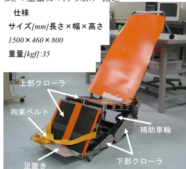
写真1 救助支援型担架システムの外観