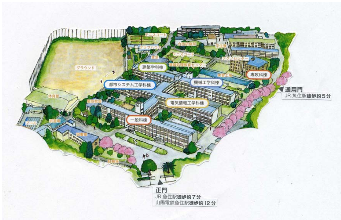
キャンパス・マップ